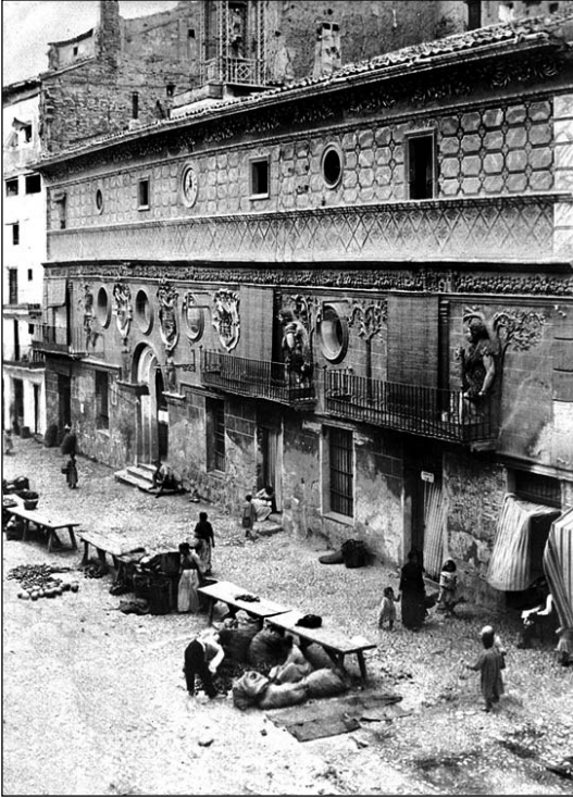
Plaza del Mercado (actual de España o del Ayuntamiento). Hacia 1915-1920.

S on las ocho de la mañana. Como cada día, los comerciantes preparan sus puestos para vender sus productos.